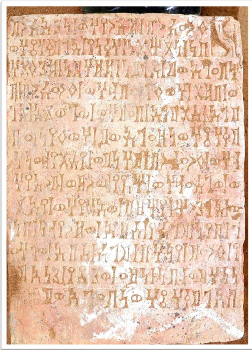
لوحة (٢) نقش (شملان 2 – Shamlan)